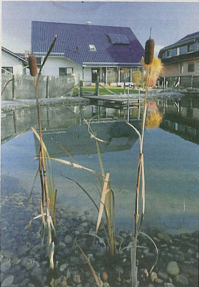
Schwimmen im Sommer, Schlittschuh laufen im Winter: Der große Teich bietet tolle Möglichkeiten, um draußen aktiv zu sein.