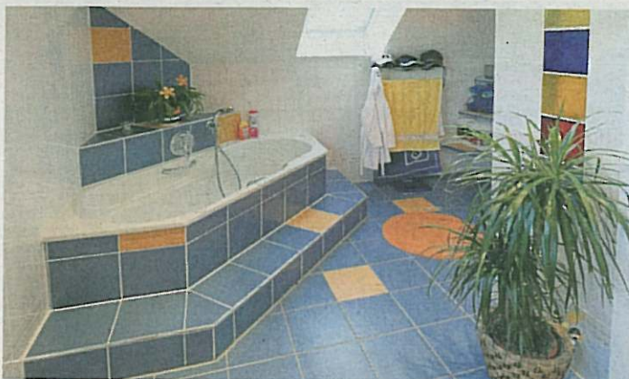
Knallig: Das bunte Familienbad sorgt bereits am frühen Morgen für gute Laune.