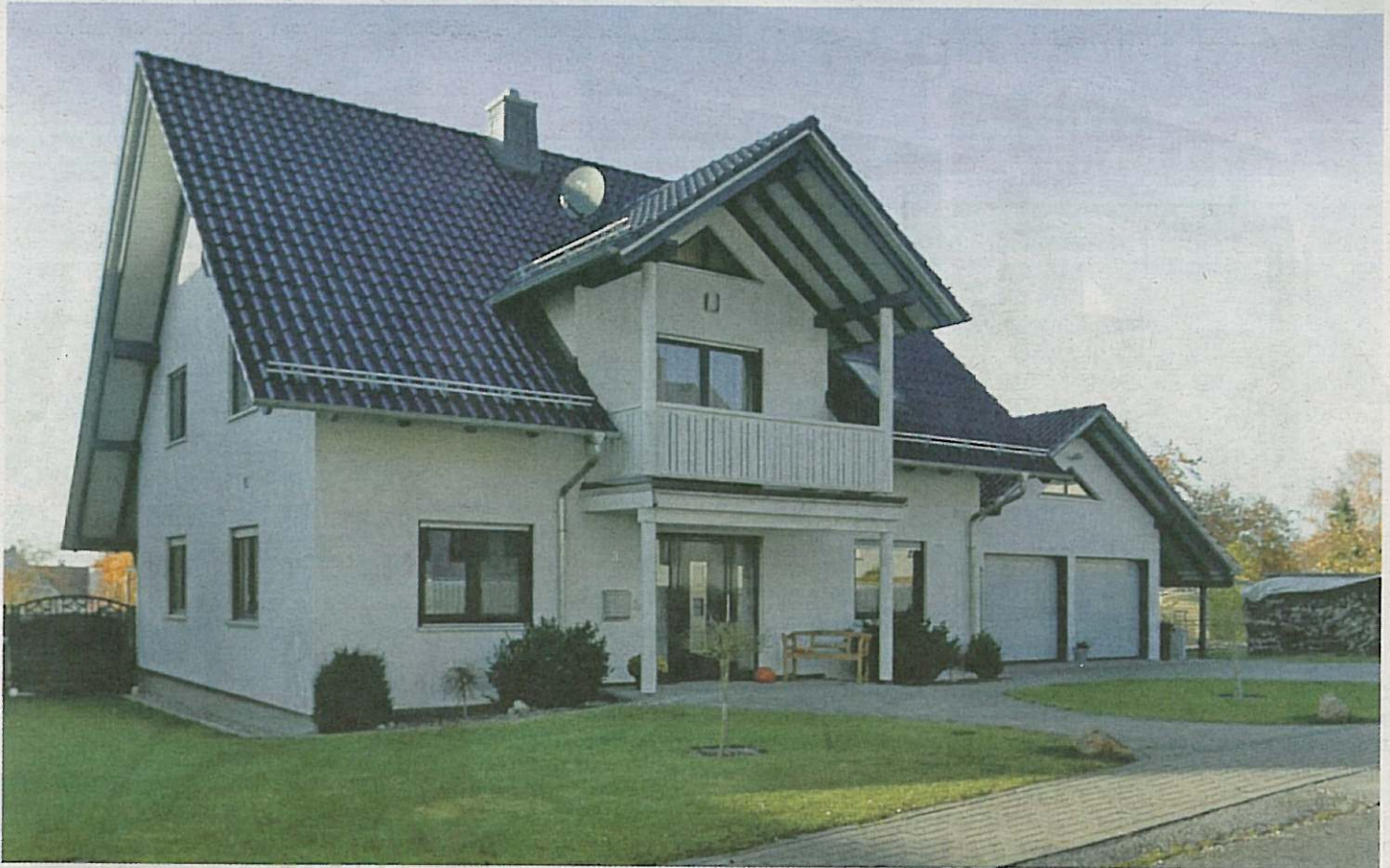
Charmant: Das weiß verputzte Haus mit den dunkelblauen Fensterrahmen ist ein echter Blickfang.