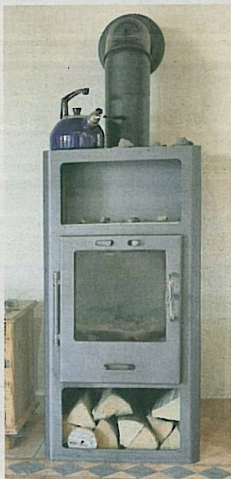
Sorgt für wohlige Wärme: Der Kaminofen im Wohnzimmer.

Der fehlende Keller wird unter anderem durch den ge-