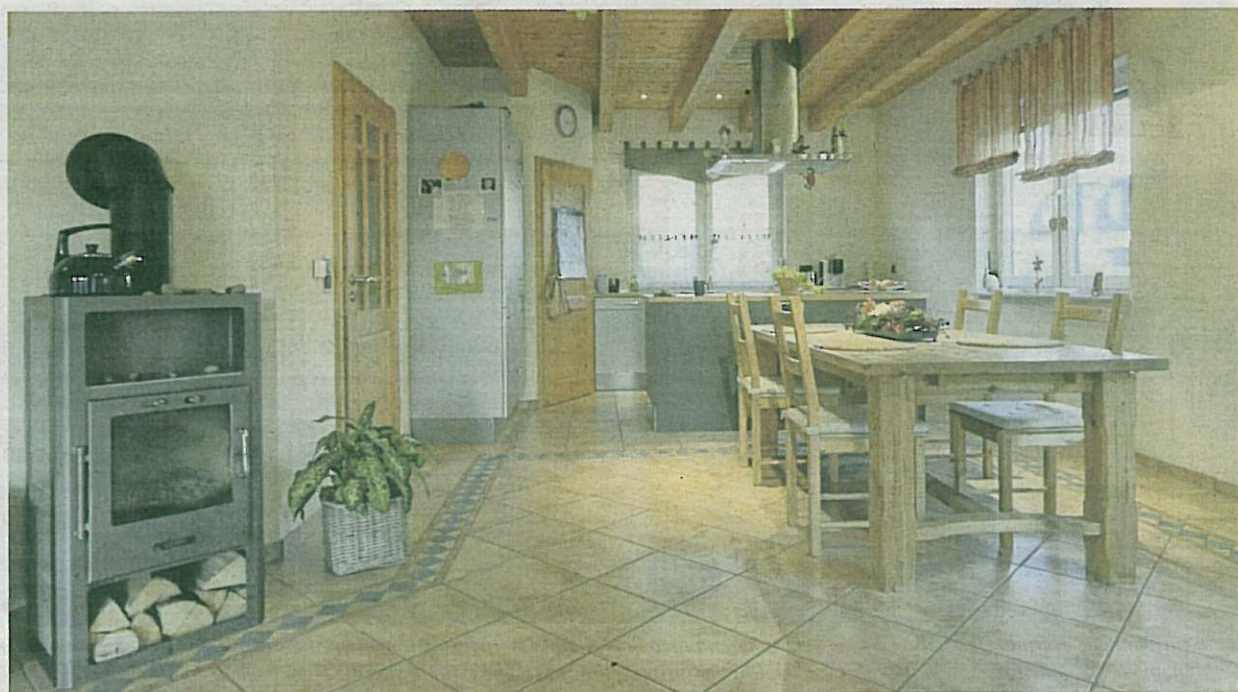
Gemütlich: Für Behaglichkeit sorgt die Vorliebe der Familie für Holz, die sich auf allen Ebenen widerspiegelt.

Dazu tragen nicht nur die vielen liebevollen Details bei, wie die Säulen vor der Haus-