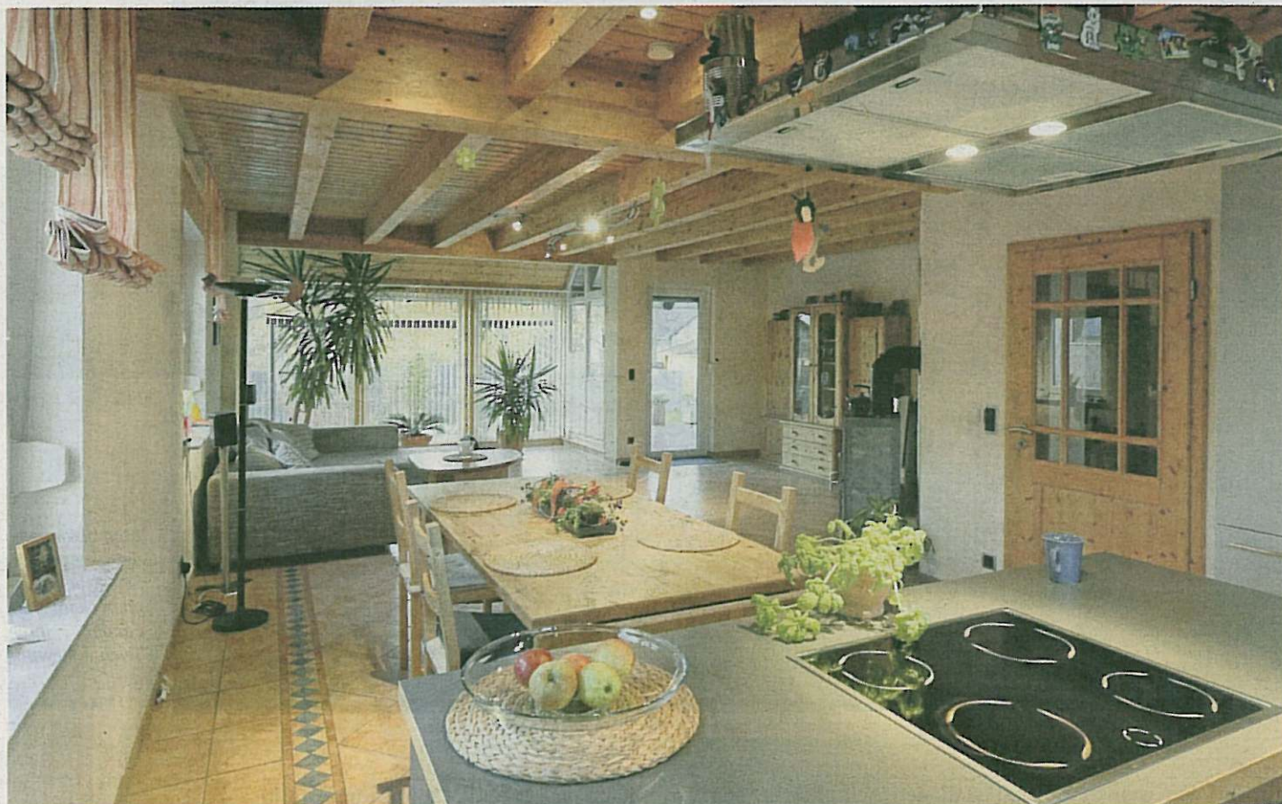
Großzügig: Der Koch-, Ess- und Wohnbereich ist offen gehalten und gibt den Blick auf den Schwimmteich im Garten frei.