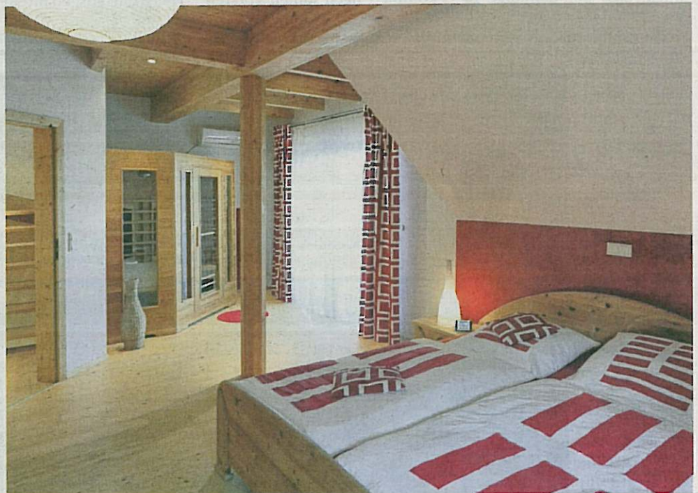
Für einen ruhigen Schlaf: Das Elternschlafzimmer wird durch die Farbgebung in Weiß und Rot zum Hingucker. Mit der Infrarot-Wärmekabine erfüllte sich die Familie einen lange gehegten Wunsch.